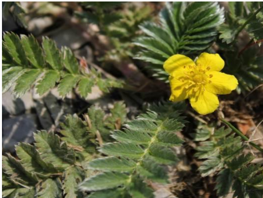
Gänsefingerkraut ( Potentilla anserina )